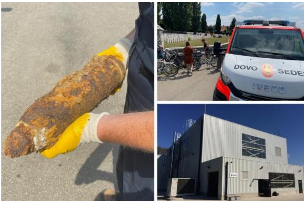
DOVO in actie en de ontmantelingsgebouwen in Poelkapelle

De reden dat Antwerpen momenteel koploper is voor interventies voor “geïmproviseerde tuigen” heeft te maken met de drugoorlog en dus met aanslagen tussen ‘kartels’. Concreet doet DOVO, samen met het labo van de technische en wetenschappelijke politie, de afstapping van de scene , of anders gezegd: het post-explosieve onderzoek (doel hiervan is om nadien de “aanslag” te kunnen reconstrueren als het tot een rechtszaak komt.)